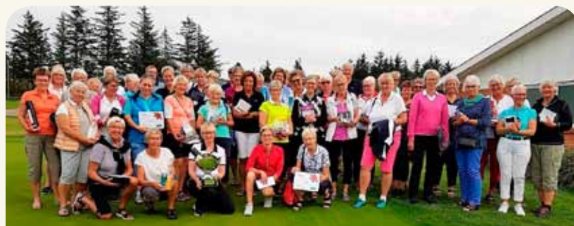
50 sygeplejersker deltog i Sygeplejerske Golf 2017, som fik støtte af Græsrodsfonden.