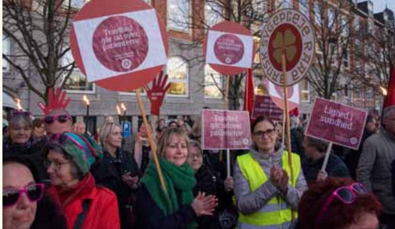
Danmark for Velfærd-demonstration i Aalborg den 7. november 2017.

Dansk Sygeplejeråd var selvfølgelig en del af samarbejdet, også i Nordjylland. Kredsen deltog i det planlæggende og koordinerende arbejde, ligesom mange af vores tillidsrepræsentanter tog del i det lokale samarbejde med FOA, 3F, Metal, Danmarks Lærerforening, BUPL og alle de andre fagforeninger, der var omfattet af arbejdsgivernes voldsomme lockoutvarsel.