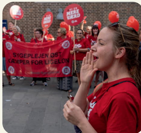
Kan I høre, hvad vi siger? Vi er den lim, der får sundhedsvæsnet til at hænge sammen! Fra byrådsmøde i Aalborg.