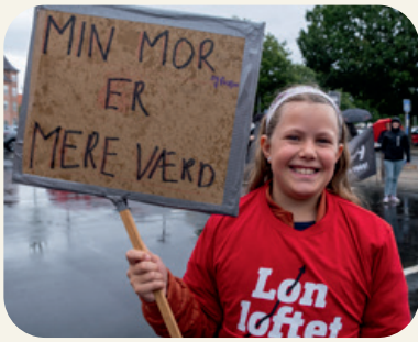
Mor er helt sikkert mere værd. Og det samme er datteren.