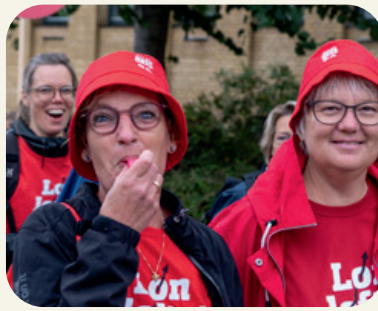
Med fløjte på jagt efter de forsvundne socialdemokrater i Brønderslev.