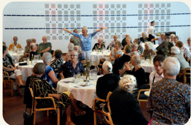
Jubilær-årgangene blev bedt sig om at rejse sig op, årgang efter årgang, hold efter hold.