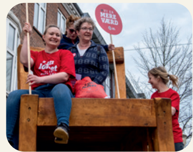
Stolen på gågaden i Hjørring indtaget af sygeplejersker.