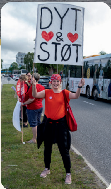
Der blev dyttet og støttet på Hobrovej i Aalborg, hvor morgentrafikken hver eneste uge blev mødt af strejkende sygeplejersker.