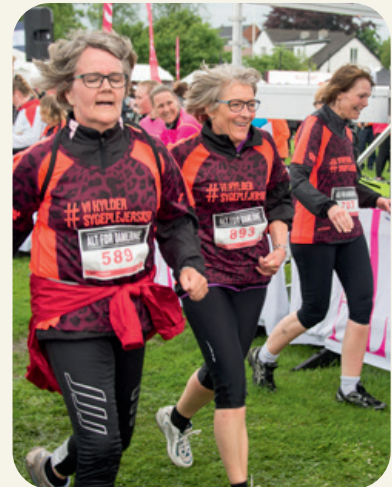
I 2017 hyldede Alt for Damerne sygeplejerskerne ved årets kvindeløb i Nørresundby.