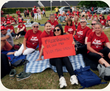
Fredag den 2. juli var flere hundrede sygeplejersker fra hele Nordjylland samlet på græsset ved kredskontoret til taler, hygge, øl, vand og pølser.