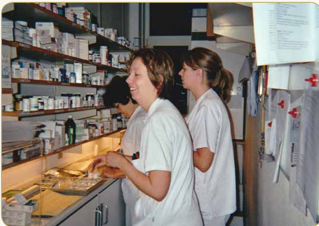
Der var trange kår og nogle gange kø i det gamle medicinrum på Aalborg Sygehus Syd. Foto fra 2005 – kort før Medicinerhuset blev taget i brug

Og alle papirer – både dem med og uden personfølsomme oplysninger – blev faxet rundt.