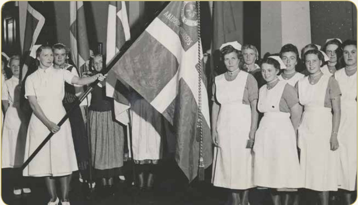
Aalborg Amtskreds indviede sin nye fane i 1941. I Tidsskrift for Sygepleje (som i dag hedder Sygeplejersken) stod der: ”Indvielsen fik en meget smuk og stemningsfuld Optakt, idet Sygeplejersker, iført de fem nordiske Landes Nationaldragter, tog Opstilling med de nordiske Faner, før Kredsens smukke Dannebrog blev ført ind”

Dansk Sygeplejeråds hovedbestyrelse afhørte efterfølgende de fire afdelingssygeplejersker, og da tjenestemandsdømmene forelå, blev to af dem ekskluderet, en fik en misbilligelse, og den fjerde blev frikendt på grund af mangelfuld bevisførelse.