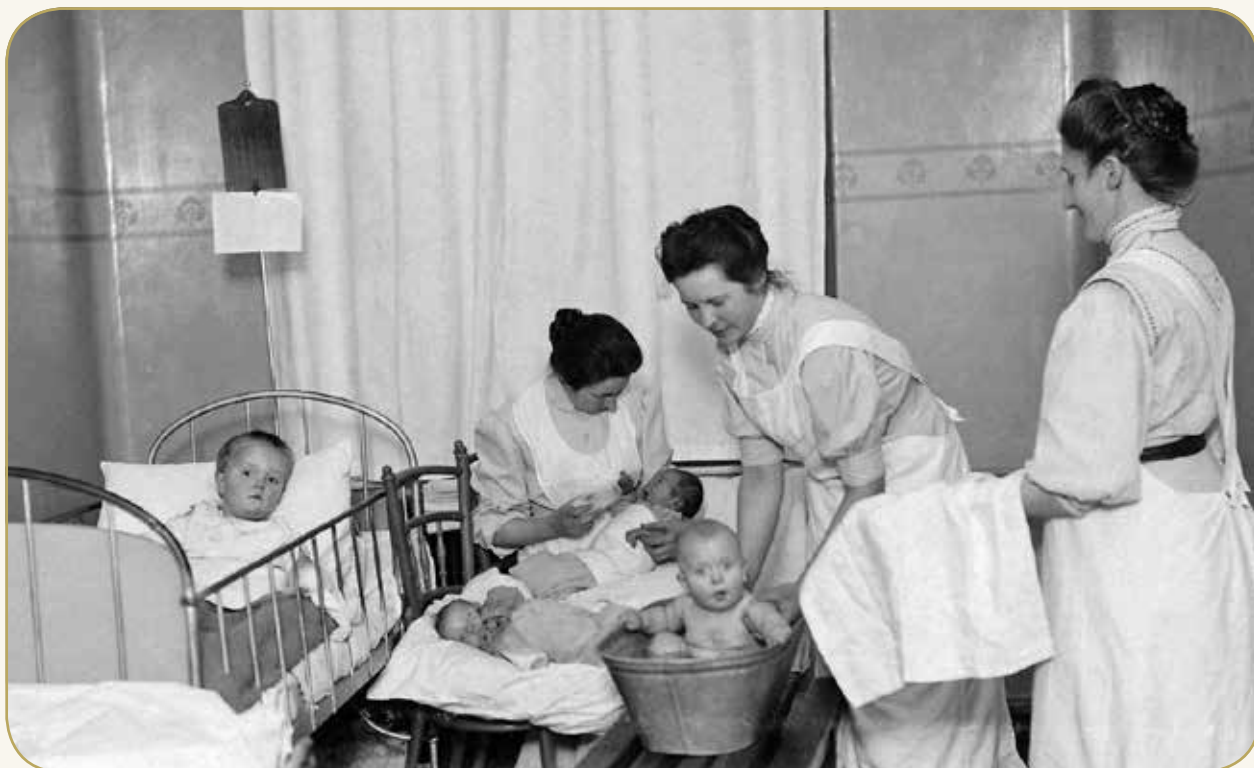
Børneafdelingen på Hjørring Amts og Bys Sygehus