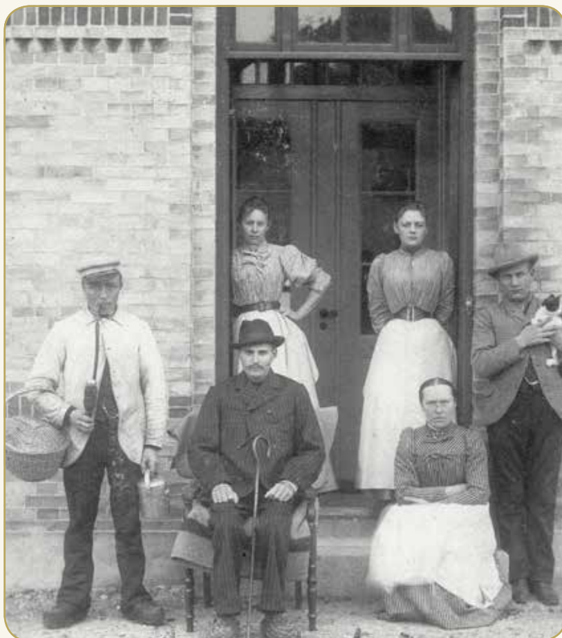
Personalebillede fra Farsø Sygehus

”Der var ikke meget, vi kunne gøre for at helbrede og lindre. Difteritispatienter kom i damp, og tyfuspatienter levede udelukkende på mælk. Vi havde en tuberkulosepatient, som havde fået amputeret det ene ben. Han havde træben, et stort tungt et, som han ikke kunne bruge. Han havde boet på sygehuset i flere år, og kom aldrig ud. Ham bar jeg ud i haven om sommeren og lagde ham på en bære, så han kunne få frisk luft og nyde haven.”