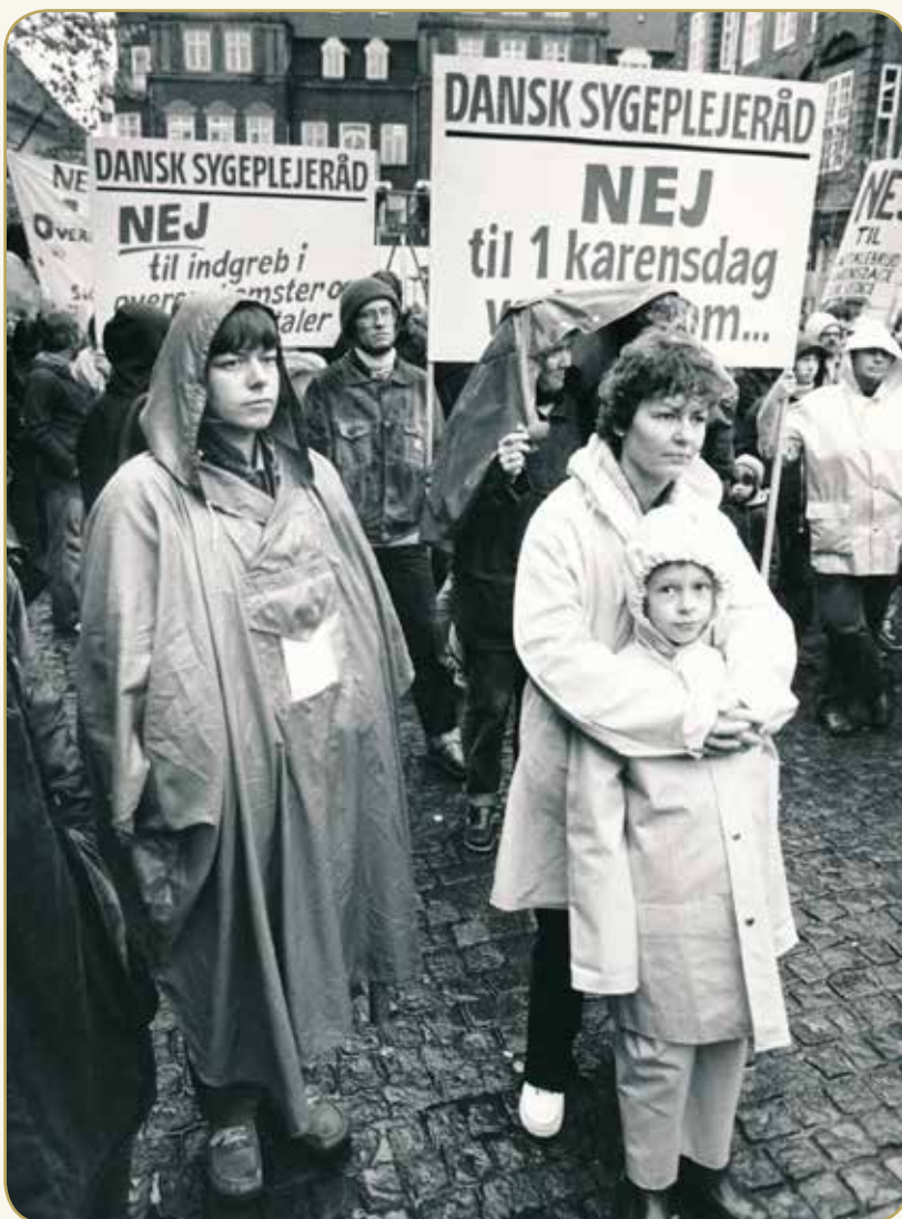
Dansk Sygeplejeråd var med til at demonstrere i Aalborg mod regeringens indgreb i overenskomstforhandlingerne i 1985 – også kendt som Påskestrejkerne. Regeringen sænkede den ugentlig arbejdstid fra 40 til 39 timer (fagforeningernes krav havde været 35 timer)

I 80'erne kom også de integrerede ordninger, hvor man som sygeplejerske nu både kunne være ansat på plejehjem og i hjemmesygeplejen på én gang.