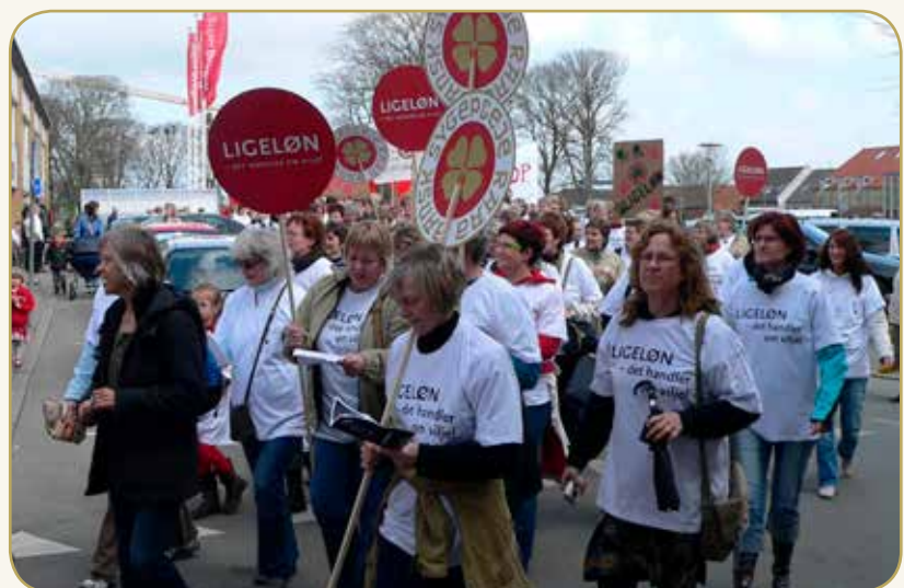
Demonstration i Thisted den 16. april 2008