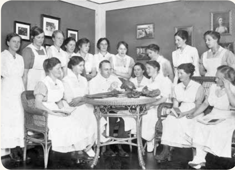
Anatomiundervisning på Aalborg Kommunehospital, 1915