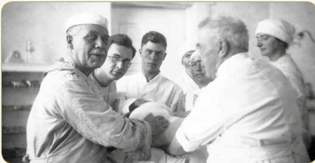
Operation på Frederikshavn Sygehus, 1926

"På en stue, hvor der ligger flere mennesker sammen, vil der altid, som oftest på grund af mangel på anden og bedre interesse, blive en del sladder og kritik af lægernes og sygeplejerskernes arbejde. Det gælder her for eleven om ikke at indlade sig på at diskutere sligt, men på alle måder søge at styrke tilfredsheden og tilliden."