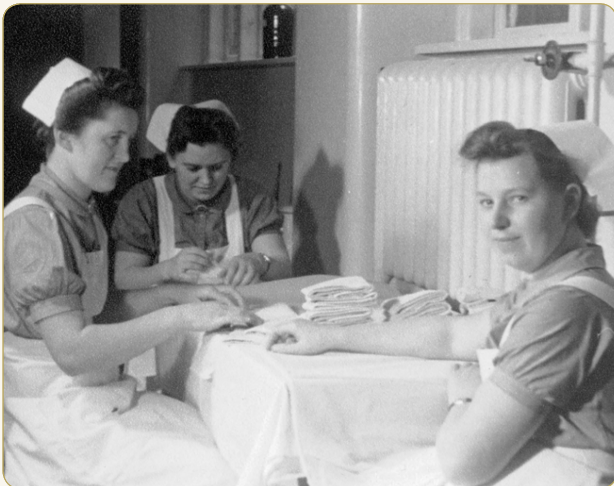
Tre elever folder klude på Terndrup Sygehus

Selv om den katolske menighed i Danmark ikke er særligt stor, drev både munke og nonner adskillige hospitaler. I Aalborg i første omgang Kamillianergaarden, der senere blev barselsang, flygtningecenter og senere hospice. Og i 1929 indviede katolske nonner det store Sct. Josephs Hospital på Kastetvej i Aalborg, der fungerede som sygehus helt frem til 1990. I dag er der ejerlejligheder i bygningerne.