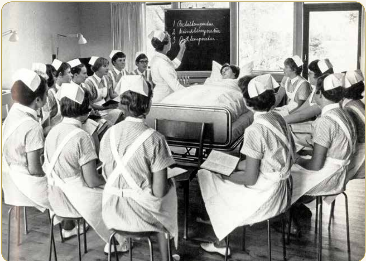
Hjørring Amts Sygeplejerskole blev oprettet i 1956 på centralsygehuset og fik i foråret 1966 sin egen skolebygning. Billedet er fra 1967

"Noget specielt ved stuegang førhen var, at patienterne skulle ligge i sengen, dynen ligge glat og de måtte næsten ikke røre sig. Det var heller ikke patienten, der snakkede med lægen, men sygeplejersken, som svarede for patienten."