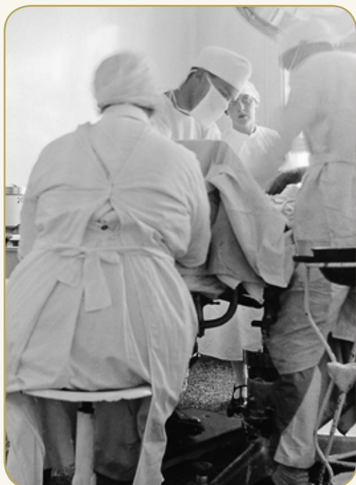
Operation på Farsø Sygehus

"Man måtte i vid udstrækning benytte løs hjælp i form af vågekoner – de var faktisk også omtalt i sygehuset reglement. Der er givetvis mange af de vågekoner, der har virket ved vores sygehuse, der har ydet en udmærket indsats, og bestyrelsen anså da også et brev, som man modtog i 1935, for urimeligt. En brevskriver, som man i øvrigt ikke var i stand til at identificere, klagede over de vågekoner, som sygehuset satte til at sidde vagt. De blev karakteriseret som en flok gamle ludere med særlig fremhæven af 2 navngivne. Bestyrelsen mente dog ikke, at man skulle tage sig af sagen."