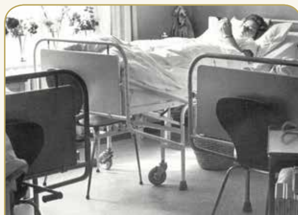
Trange forhold på sygestuen på Farsø Sygehus 1965

"Man kaldte det et lille sygehus, dog kunne en aftensygeplejerske opleve at have ansvaret for 72 patienter, da begge afdelinger en overgang var slået sammen i aften- og natteimerne."