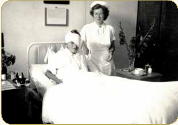
Thisted Sygehus, 1946