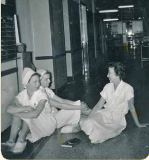
To sygeplejersker og en reservelæge sidder på gulvet på operationsafdelingen på Aalborg Amtssygehus en sen natteime i 1961