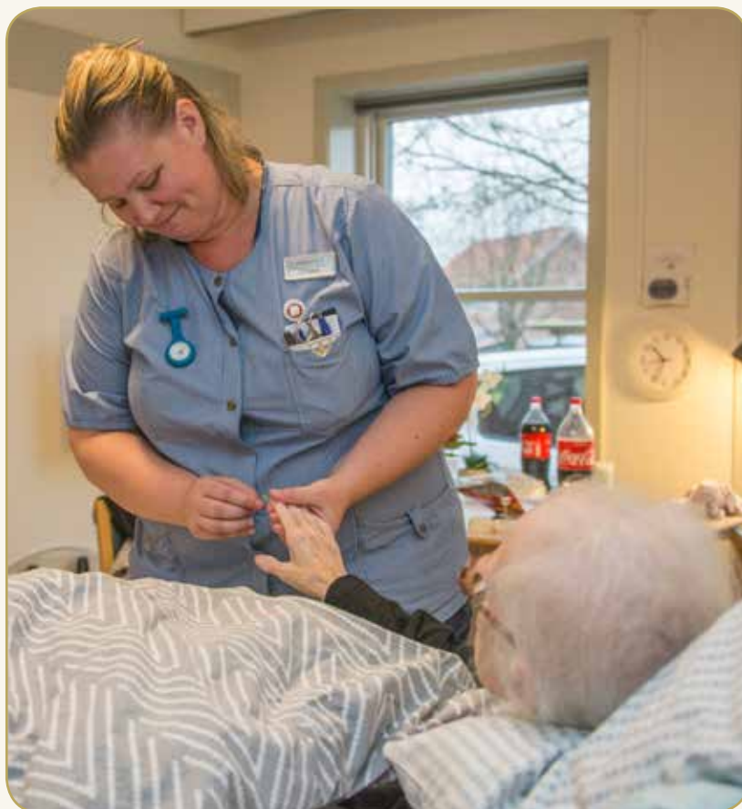
Aalborg Kommune har både akutteam og akutpladser (foto fra 2017)

I 2014 begyndte Aalborg Kommune et pilotprojekt med at triagere borgerne, hvilket bl.a. giver et bedre samarbejde med vagtcentralen. I dag er det et udbredt arbejdsredskab i kommunerne.