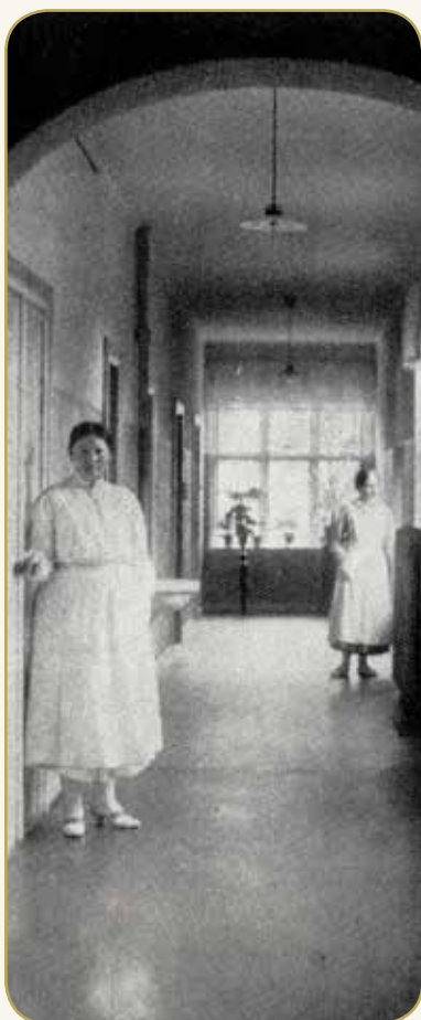
Korridorbillede fra Farsø Sygehus

hed, hvis man selv sørgede for heste. Landmanden viste sig at have et subduralt hæmatom, som blev ud-tømt under en operation.