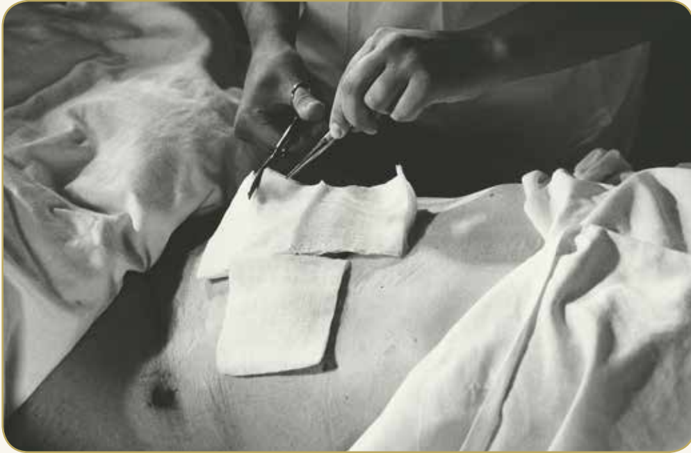
Skift af forbindelse på Aalborg Sygehus Syd, 1976