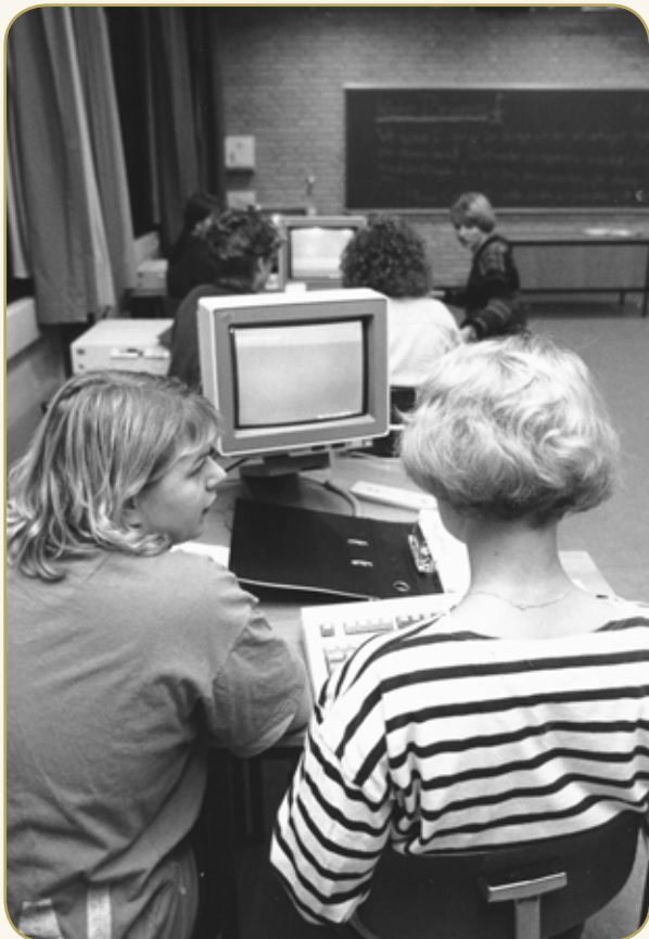
Aalborg Sygeplejeskole, 1997

I 1990 kom en ny sygeplejerskeuddannelse. Den betød bl.a., at ansøgerne nu hed 'studerende' og ikke længere 'elever', at uddannelsen blev tre måneder længere (3 ¼ år), at de studerende med undtagelse af sidste praktikperiode fik SU frem for løn og ikke længere var en del af normeringen.