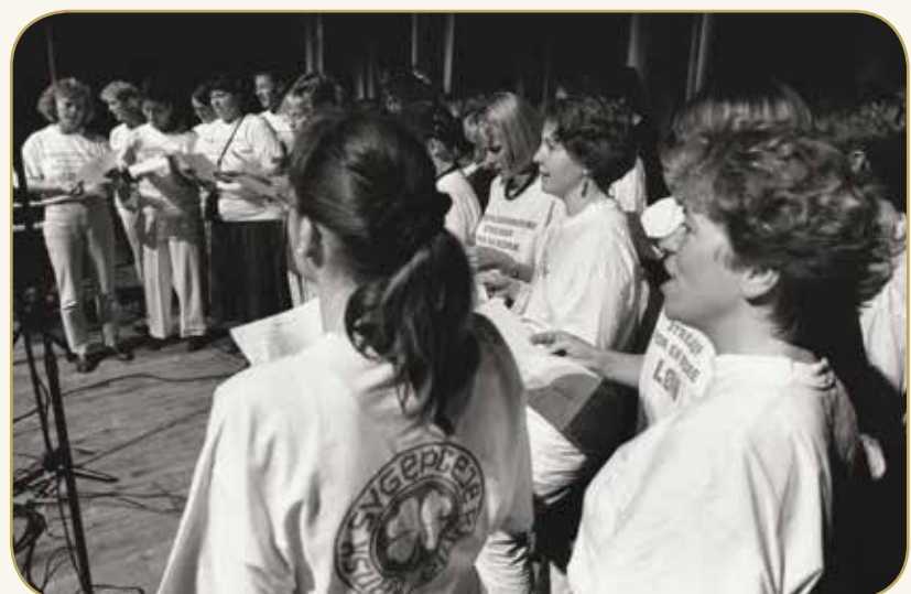
'Lønfest' i Aalborghallen den 16. maj 1995

"Jeg kan huske under en konflikt, at en sagde til mig: Du behøver ikke strejke – du kan bare sige til de sygeplejersker, du møder, at de bare kan komme til os og arbejde i stedet."