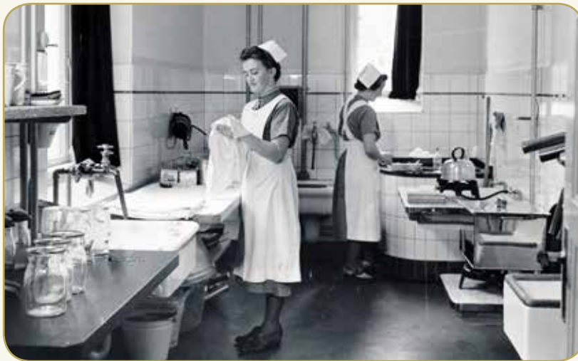
To sygeplejersker i skyllerummet på Aalborg Amtssygehus

"Patienterne blev på daværende tidspunkt kun badet én gang om ugen. Det foregik almindeligvis som etagevask i sengen. For at man kunne nå det daglige arbejde, skulle nattevagten være færdig med at vaske alle patienter, inden dagvagten mødte kl. syv. Patienterne blev vækket allerede kl. fem, undertiden før. Arbejdet var ret besværligt. Der var ikke indlagt vand på stuerne. Det blev bragt i spande og hældt op i omdelte vaskefade. Efter morgentoiletet var det elevernes opgave at fjerne vand og fade."