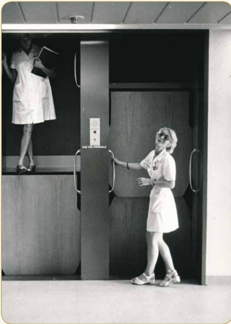
I 1976 prydede dette billede forsiden af Sygeplejersken med teksten: Den stedsegående elevator, også kaldet en "pater noster", giver hurtig forbindelse mellem etagerne på Aalborg Sygehus Syd