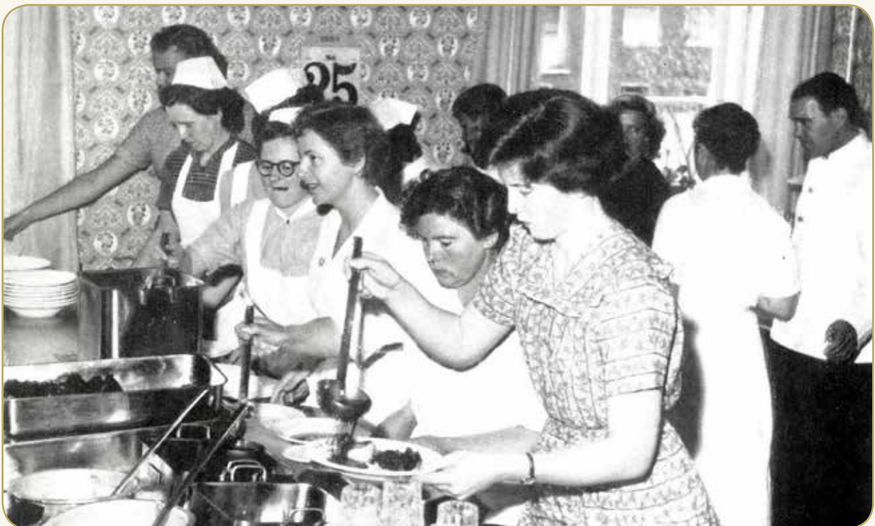
Personalets spisestue på sygehuset i Hjørring, 1954