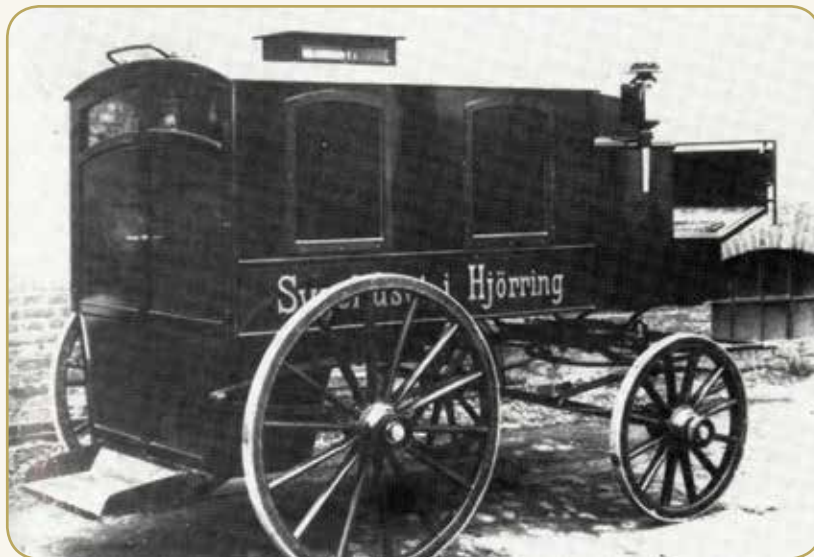
Hjørring Sygehus' sygetransport indtil 1918

Manden skulle først bringes hjem fra marken, så skulle der sendes vogn efter lægen, da man formentlig ikke havde telefon (centralen nær gården havde kun syv abonnenter og luk-