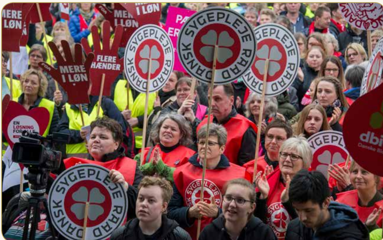
Fællesdemonstration i Kildeparken i Aalborg 16. april 2018