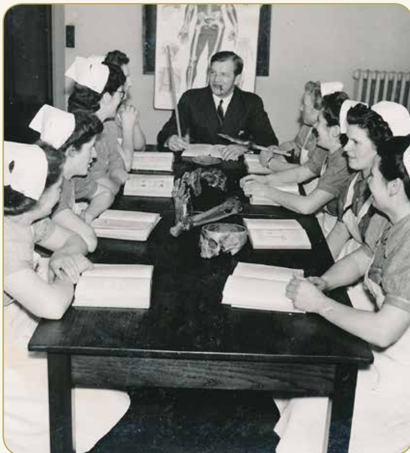
Anatomiundervisning, Brønderslev Sygehus

Da hun var gået, tog jeg en flaske og fyldte op, og så flyttede jeg stregen og gjorde mig meget umage med at få den til at ligne den, hun havde lavet. Man lavede likør af spritten med noget ekstrakt, man købte på apoteket og kom i. Så var der den herligste likør. Jeg lavede kun likør en gang. Jeg kunne ikke lide det".