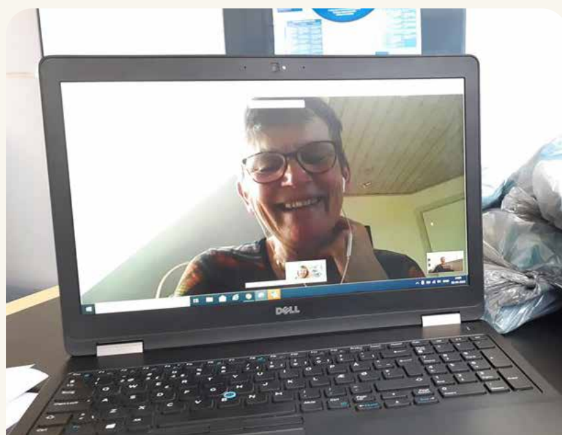
Mange fysiske møder er blevet erstattet af elektroniske siden corona. Billedet er fra Mariagerfjord Kommunes TR-kollegie, der "mødtes" gennem WebEx.